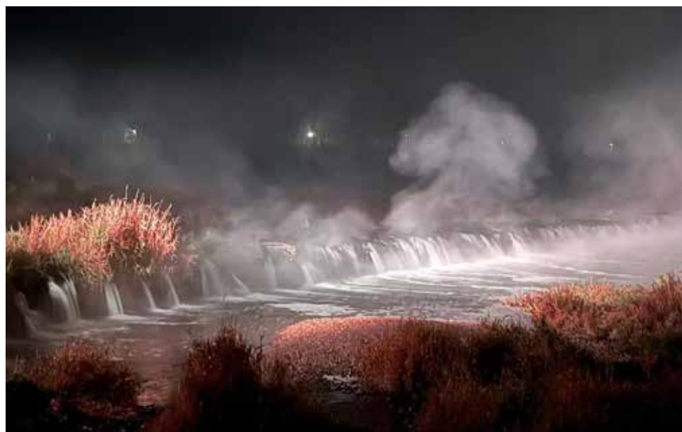
Tādi kūpoši miglas vāli kā naktī uz pirmdienu virs Ventas rumbas gadoties ļoti reti.