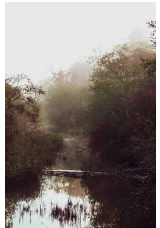
2. vietā ar 170 balsīm – Anetes Tuleiko (Skrunda) darbs.

Labāko darbu autori saņems balvas, visi foto paliks kultūras namam un tiks izmantoti pēc vajadzības: pasākumu reklamāmai, simbolikai u.tml.