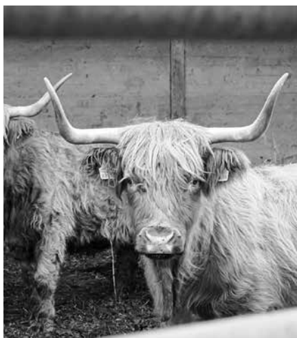
Vāplokos – Hailendas šķirnes liellopi.