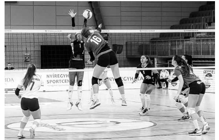
Anija ar 16. numuru.

Jā, pirmā. Kad mācījos Murjāņu Sporta ģimnāzijā, spēlēju arī tajā komandā. Pēc tam pārgāju uz Rīgas Stradiņa universitātes un Minusas volejbola skolas komandu. Ar abām spēlēju Latvijas čempionātā, Latvijas kausa izcīņā. Ar pēdējo komandu arī Baltijas līgā, bet tur tik labi neveicās. Vienlaikus spēlēju Latvijas Sporta pedagogijas akadēmijas komandā. Tajā gan vairāk prieka pēc.