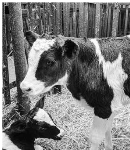
Bētās ir ap 70 ataudzējamu teliņu.