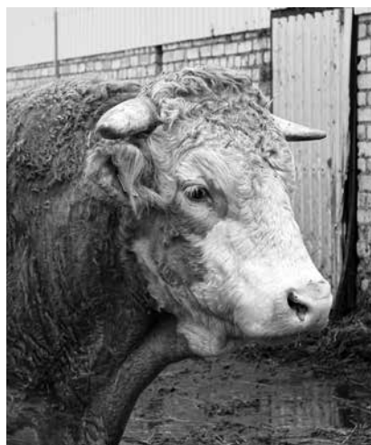
Simentāles šķirnes bullis, kam dots visai ērkšķains vārds Kaktuss.