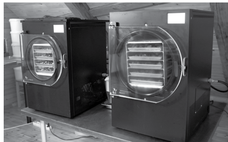
Saldēšanas un žāvēšanas iekārtās sausais saldējums top apmēram 15 stundās.

SIA Diezgan svaigi , ir ražotas Amerikā. Pirmā pasūtīta no ASV, taču bijis jāmaksā liels muitas nodoklis, tādēļ atrasts iekārtu tirgotājs Lietuvā. Vai Latvijā ko līdzīgu dara arī citi? Konkurence esot diezgan liela, taču cita saldējuma tieši tādā izpildījumā vēl nav. Šovasar Vidzemē parādījies ražotājs, kam ir kaut kas līdzīgs.