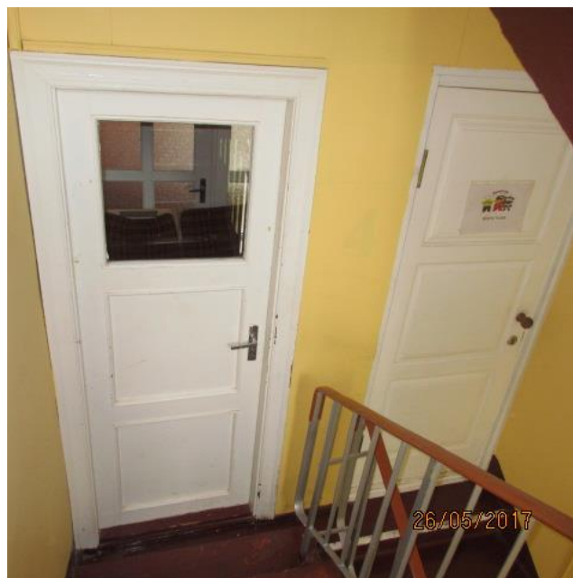
Bloķēta izeja uz ēkas 5. stāvu